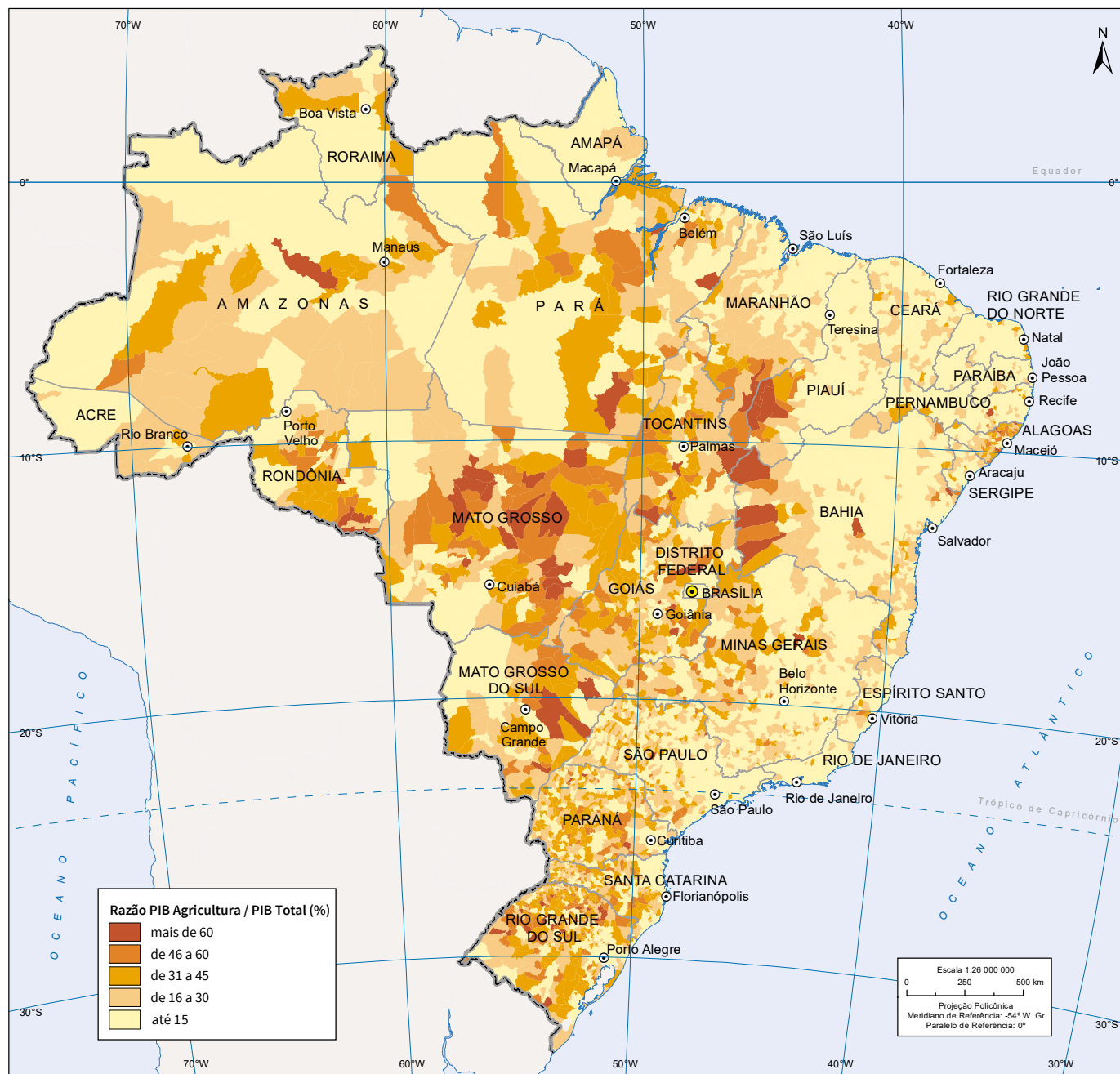
Distribuição de estabelecimentos agropecuários, por faixas de área - 2017